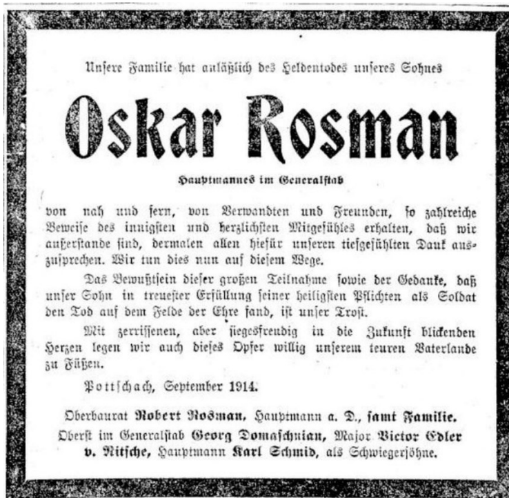
Abbildung 4: Sterbeanzeige Neue Freie Presse 3.9.1914/ANNO 48